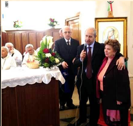
Dono di portachiavi con stemma passionista e logo Aseap agli alunni partecipanti