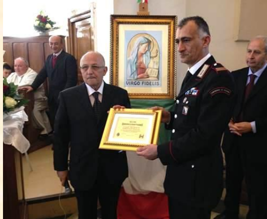
Aseap: Pergamena Ricordo Al Comando della Stazione Carabinieri di Calvi Risorta