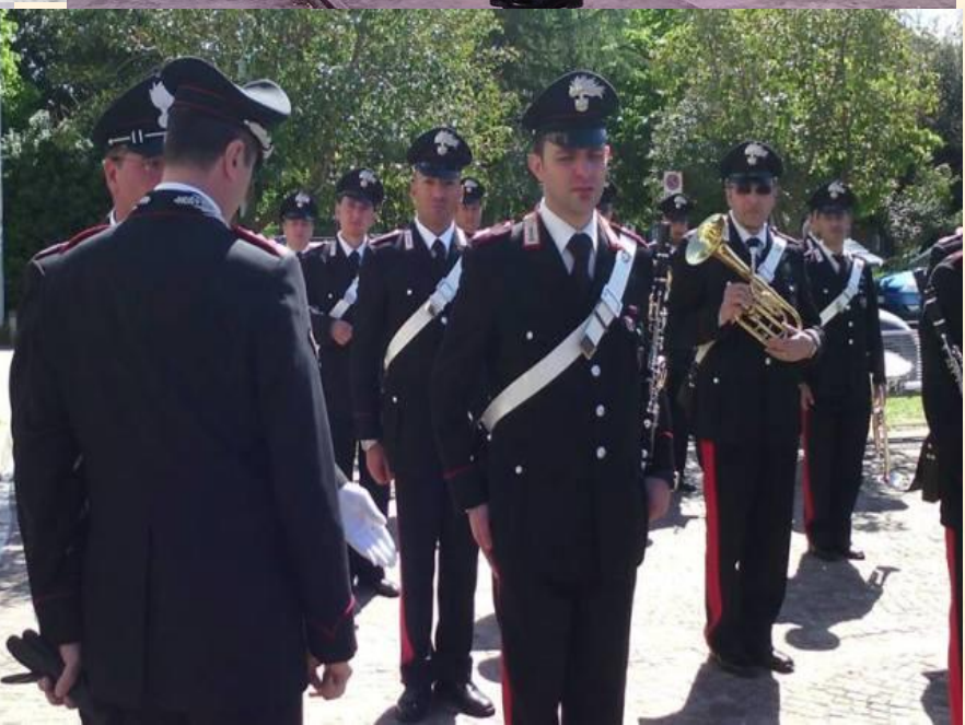
Omaggio dell'ASEAP di una corona d'alloro ai Carabinieri caduti in servizio