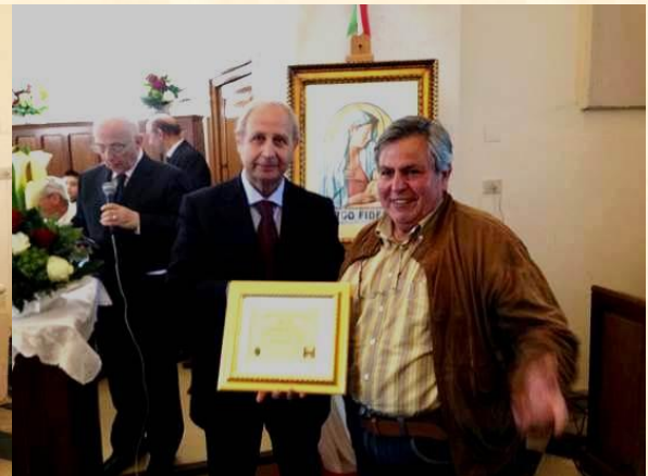
Aseap: Pergamena Ricordo Alla Scuola Statale "Cales" di Calvi Risorta (CE)